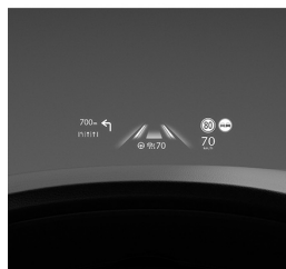
CZYSTA PRZYJEMNOŚĆ PROWADZENIA

Czysta przyjemność prowadzenia. Wnętrze każdego modelu Mazdy charakteryzuje szlachetny minimalizm, dlatego żadne dodatkowe bodźce nie rozpraszają uwagi kierowcy, który może w pełni skupić się na prowadzeniu i czerpać z niego maksimum przyjemności.