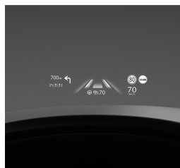
CZYSTA PRZYJEMNOŚĆ PROWADZENIA

Czysta przyjemność prowadzenia. Wnętrze każdego modelu Mazdy charakteryzuje szlachetny minimalizm, dlatego żadne dodatkowe bodźce nie rozpraszają uwagi kierowcy, który może w pełni skupić się na prowadzeniu i czerpać z niego maksimum przyjemności.